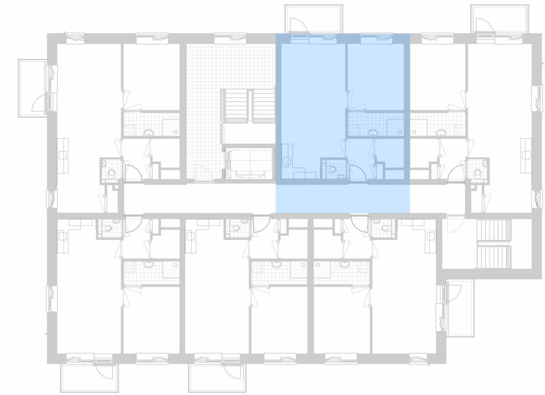
plattegrond appartementen 1:200